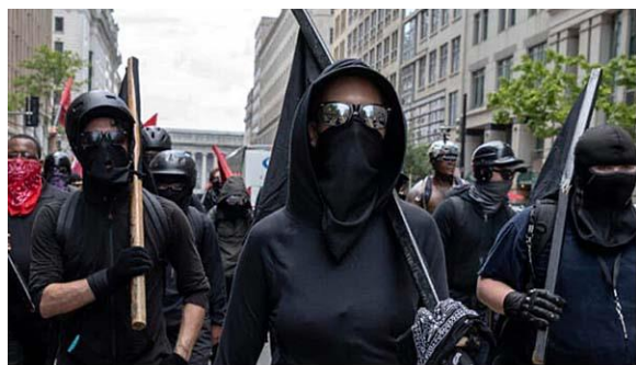
Antifa - ty roušky byly navrženy přímo pro ně

Každé čtyři takové jednotky spadají pod „kapitána,“ který jim udílí příkazy. Kapitán se volně pohybuje mezi protestujícím a ničícím davem a opět, je ho možno poznat podle časného styku s jezdcí na kolech a také podle určitých venkovních znaků, což je hlavně video kamera určitého typu a tvaru. Když svolávají své podřízené, je možno tyto kapitány vidět, jak drží kameru vysoko nad okolním davem a signalizují bleskem. Mikrofon na DX SDR vysílačku má kapitán většinou na krku a takto udílí nepozorovaně rozkazy jednotlivým velitelům.