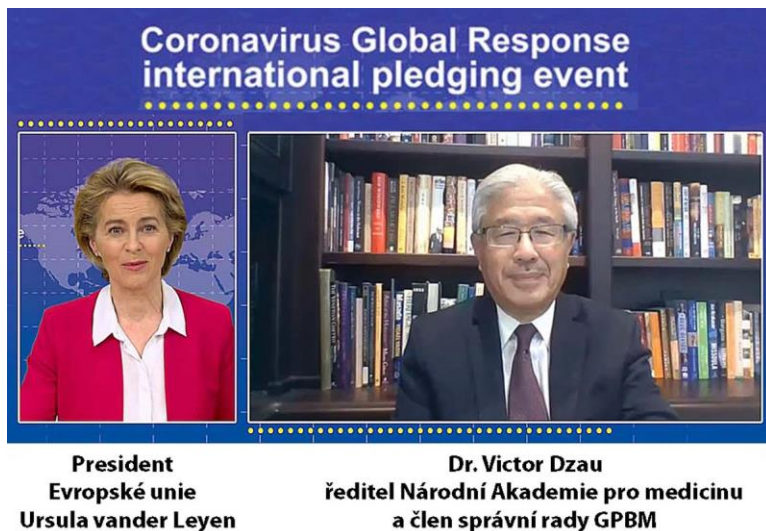
President Evropské unie Ursula vander Leyen

V záhlaví konference se nacházela silná hesla, jako na příklad „Spojení proti Koronaviru,“ „Společně silnější“ a „Globální odezva.“ Ale o co opravdu šlo a co to pro nás znamená, je něco zcela jiného než nadšený boj proti zákeřnému viru. Jednotliví účastníci konference byli rovněž zachyceni na videu, kde zdůrazňovali důležitost tohoto setkání. Ať to byli zástupci Omanu, nebo Monaka, Itálie, Estonska, nebo kterýchkoliv jiných zemí, všichni opakovali ta stejná hesla: „musíme zajistit snadný přístup k očkování, k léčbě a diagnostice.“ Jakoby to měli odněkud přikázáno, ve všech proslovech se ozývala ta stejná hesla.