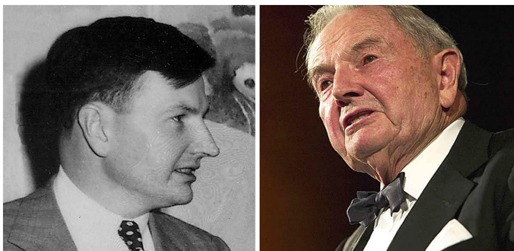
David Rockefeller, 1953 7 (vlevo) a 2003 8 (vpravo)