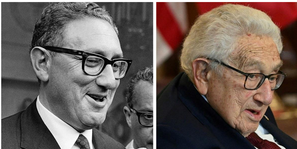
Henry Kissinger, 1969 5 (vlevo) a 2022 6 (vpravo)

Osvědčený způsob, jak poznat že se jedná o rozdílného člověka je jeho ucho. Posuďte sami.