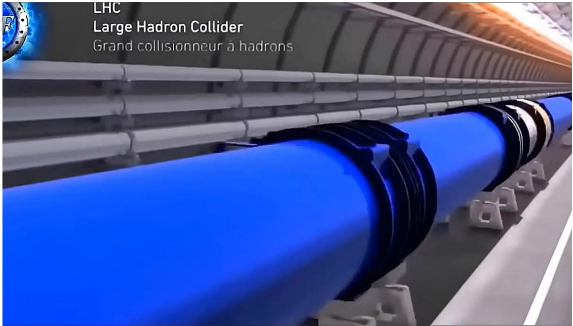
LHC Large Hadron Collider Grand collisionneur à hadrons