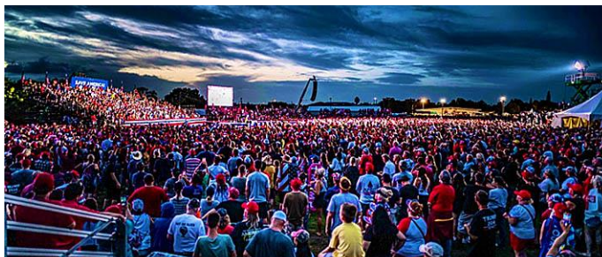
Současné Trumpovo shromáždění, 2021

Jako president se zdál progresivní a nebojácný. Velké množství zločinů bylo odhaleno a viníci potrestáni. Některé skutečně humánní zákony vešly v platnost a lidé začali mít naději, že se celková situace lepší. Nějaké drobné mráčky na politické obloze byly ignorovány, i když tyto později přinesly vážné problémy. Přesto, většina národa stála za Trumpem, viz obrázky níže .