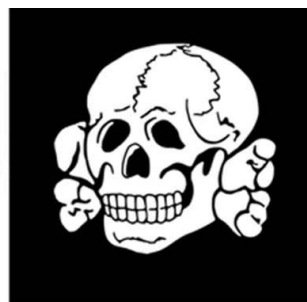
Totenkopf, odznak 3. SS pancéřové divize

Takže když západní novináři filmují ukrajinské jednotky, tak po nich chtějí, aby napřed symboliku zakryli. Musí udržovat zdání správnosti. Vždyť celý svět je dnes hromadně mediemi přesvědčován, že nacisté na Ukrajině jsou jen zanedbatelná část toho všeho a zatím je to celá ukrajinská armáda.