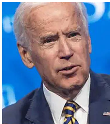
Skutečný Joe Biden, 2019

Roberts dostal v Bílém domě řádný výcvik. Byl naučen jak napodobovat Bidenovo chování, jeho chůzi, způsob mluvy a dokonce i jeho senilitu. Je o trochu starší než Biden a ve skutečnosti má také slabý dements, což je důvod, že často odbočí od psaného scénáře a pak vykládá nesmysly.