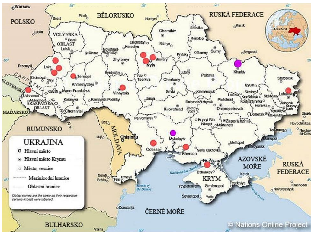
AMERICKÉ BIOLOGICKÉ LABORATOŘE NA UKRAJINĚ (červené a fialové body)

Ruská vojska rovněž ničí americké biologické laboratoře na Ukrajině, placené americkými daňovými poplatníky, které jsou podezřívány z výroby biologických zbraní, neboli jedů. Tyto laboratoře se nacházejí v následujících městech: Oděsa, Vinnicia, Užgorod, Lvov (tři), Kyjev (tři), Cherson, Ternopil a pak blízko Krymu a Luhanska. Další dvě možné laboratoře jsou ve městech Charkov a Mikolajiv, viz mapka níže.