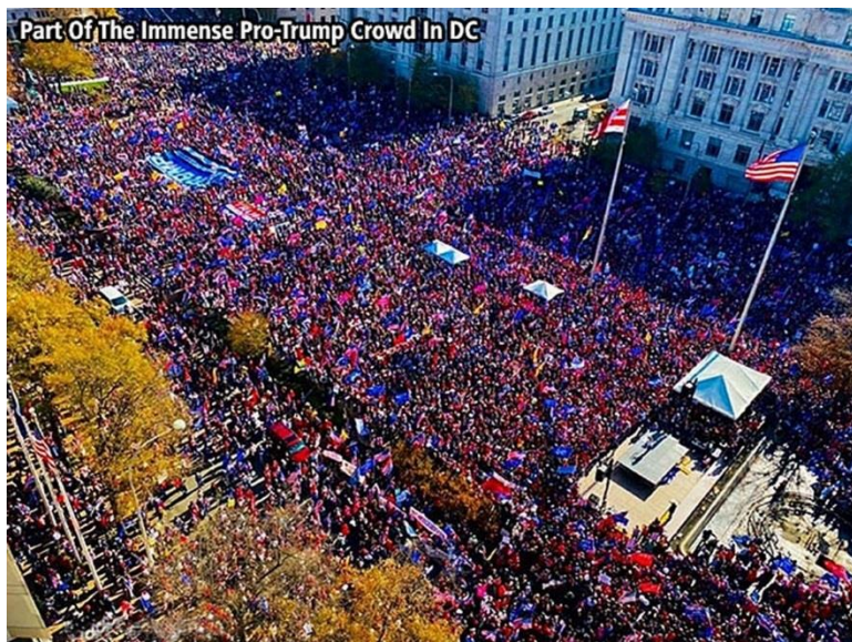
Část obrovského davu Trumpových stoupenců ve Washingtonu

Obvinění Kongresu se zakládalo na tom, že president Trump zavinil, že protestující vnikli 6. ledna 2021 do Kapitolu, kde došlo k přemožení policie, vandalismu a k úmrtí asi 4 osob. To samozřejmě není pravda, protože jednak Trump řekl protestujícím jasně a důrazně, aby se rozešli a pokojně odcestovali domů. Rovněž tak, policie v Kapitolu už na protestující čekala a ochotně jim otevírali dveře. Ti, kteří vedli celé procesí do Kapitolu byli BLM a Antifa, které tam předtím navozili v autobusech, s policejním doprovodem, jak již bylo psáno dříve. Na video záznamu je dokonce policista, který měl správně Kapitol bránit, jak se s jedním vetřelcem náramně bratříčkuje a společně se fotografují pomocí mobilu. Zjevně staří známí.