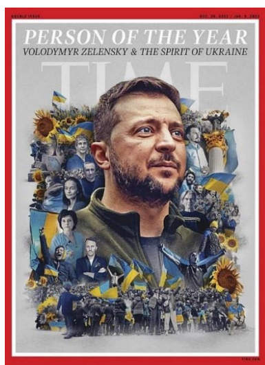
Současné vydání časopisu "Time:" Osobnost roku - Zelenský & duch Ukrajiny