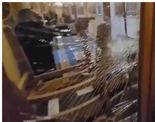
Vrah Ashli Babbitt

V Kapitolu došlo i ke střílení. Ashli Babbitt, která sloužila 14 let v americkém letectvu a byla aktivní podpůrce presidenta Trumpa, byla zastřelena policií . Sama byla neozbrojená a nijak se nezúčastňovala ničivé činnosti. Ale když budete sledovat video tohoto střílení ( zde , první video na stránce), tak je to zjevná a úmyslná vražda.